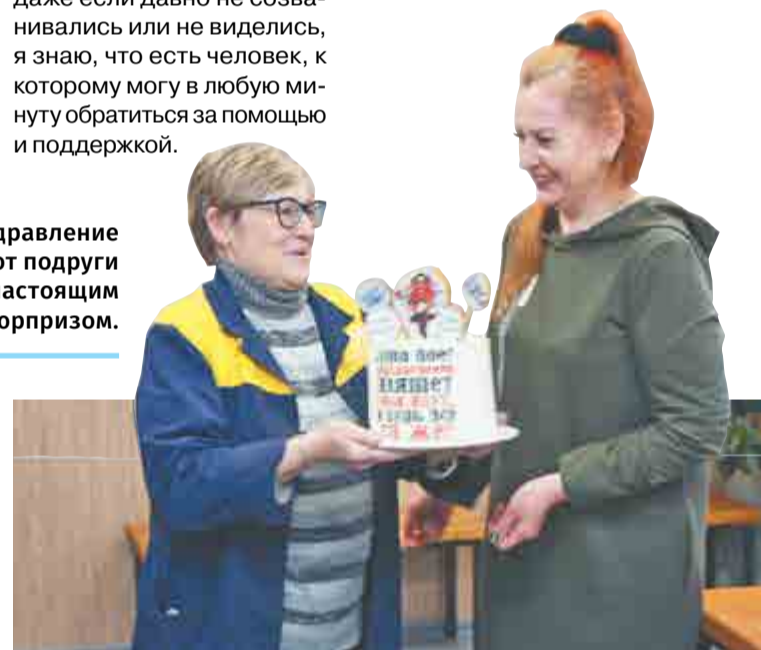
Поздравление от подруги стало настоящим сюрпризом.

Ирина БАЛАГУРОВА