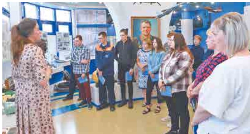
Новички-приборостроители познакомились с историей предприятия, где теперь работают.