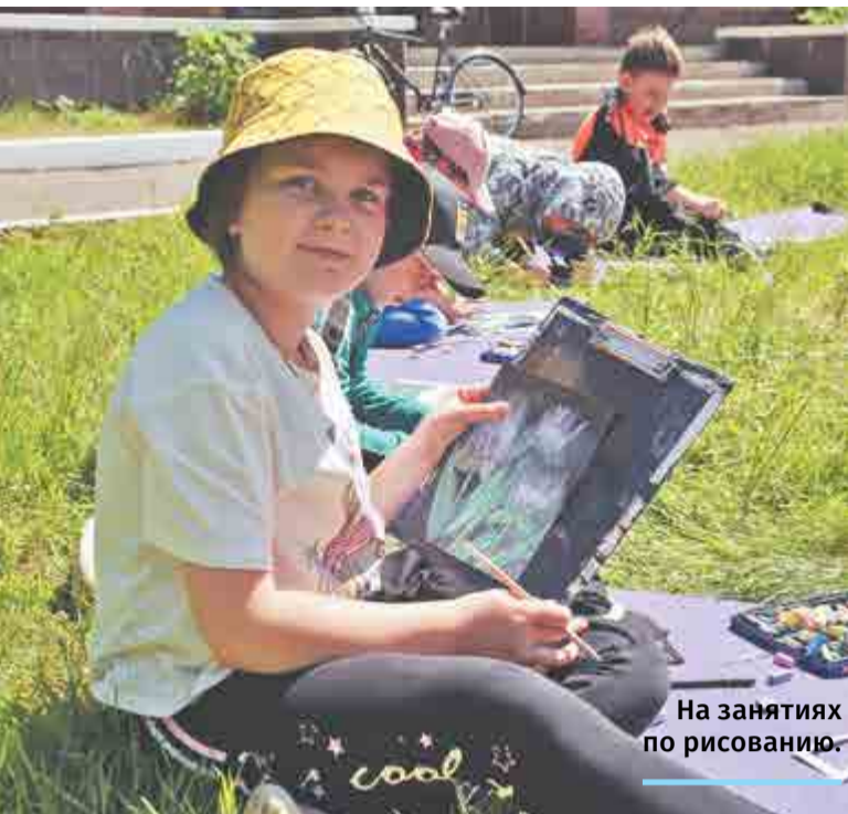
На занятиях по рисованию.