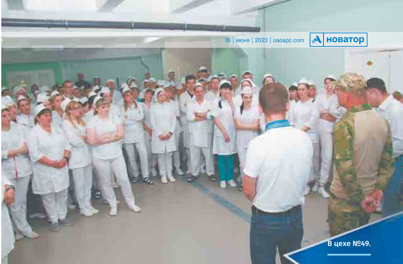
В цехе №49.