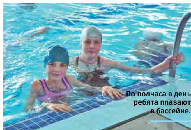
По полчаса в день ребята плавают в бассейне.

Организация детского летнего отдыха – одна из социальных программ АПЗ. В этом году стоимость путевок в разные лагеря варьируется от 28200 до 53000 рублей. Родители платят только 20% от общей стоимости путевки. Члены профсоюза получают еще и денежную компенсацию в размере 20% от затраченных средств.