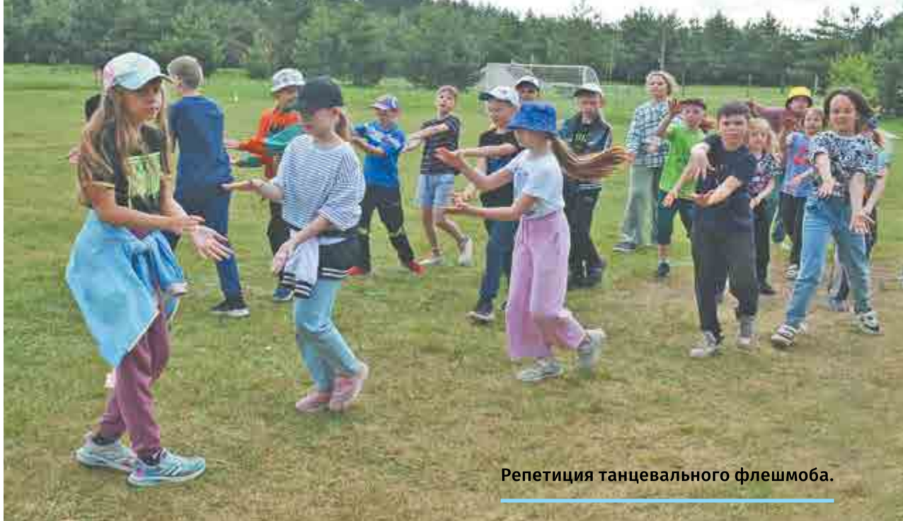
Репетиция танцевального флешмоба.