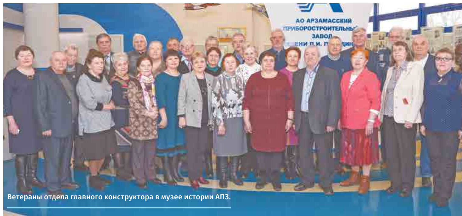
Ветераны отдела главного конструктора в музее истории АПЗ.

Гости прошли по конструкторскому бюро, где когда-то работали, поговорили с коллегами, познакомились с молодыми конструкторами. Ветераны отмечали заводские новшества, интересовались успехами новых поколений заводчан, радовались достижениям своих бывших коллег и учеников. В кабинете начальника КБ №1 бывший его руководи-