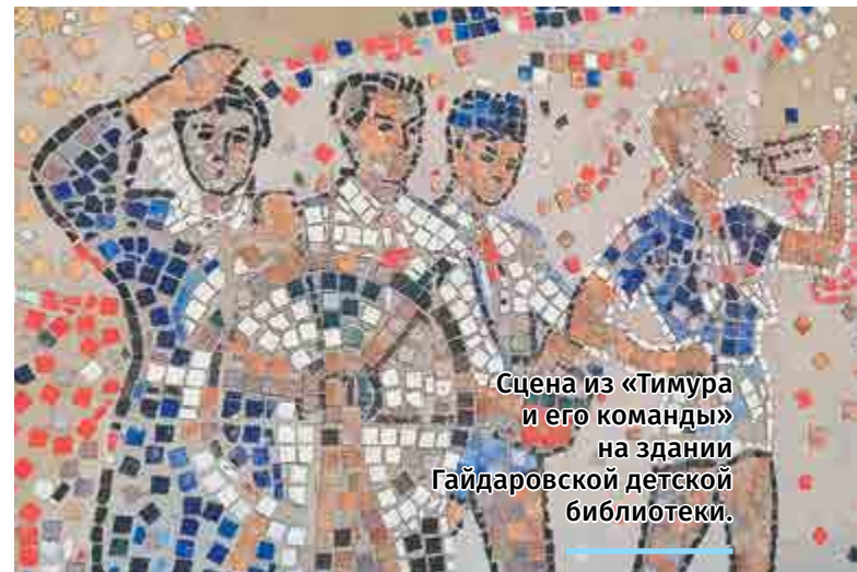
Сцена из «Тимура и его команды» на здании Гайдаровской детской библиотеки.

– Папа закончил Строгановское художественное училище. Он прекрасно рисовал, чеканил по металлу, заливал формы из гипса, занимался резьбой и росписью по дереву. Те, кто отдыхал на турбазе «Улыбка», наверняка видели там деревянные фигуры сказочных богатырей и других персонажей – их как раз делал мой отец.