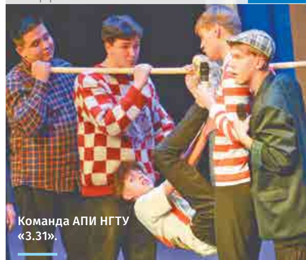
Команда АПИ НГТУ «3.31».