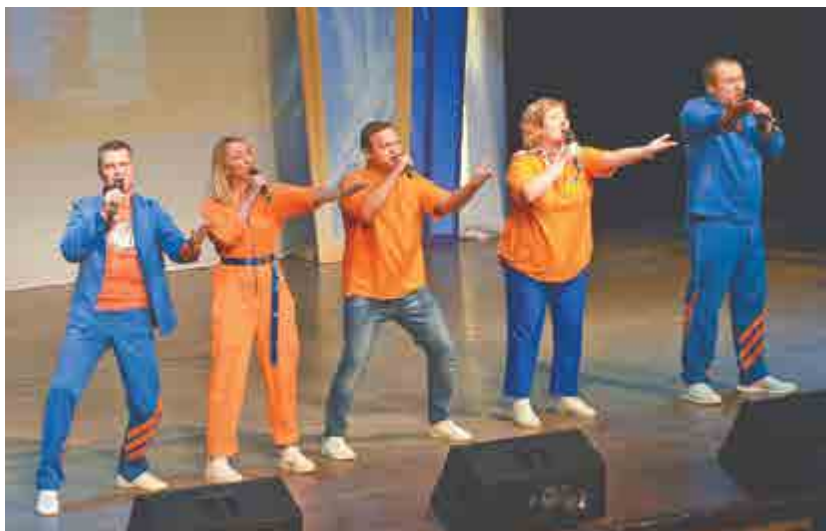
Команда «Агитбригада» – 20 лет спустя.

Открыли конкурсную программу молодые и перспективные юмористы. Это команды «Таран» (сборная школьников), «Впишите название» (школа №16) и «Колодец» (р.п. Выездное). Несмотря на юный возраст, игроки шутили по-взрослому на самые актуальные темы: о городских стройках, отношениях с родителями и учителями, зависимостях от гаджетов. Ребята читали рэп, угощали ведущего кабачками, приглашали на сельскую дискотеку. Зрители