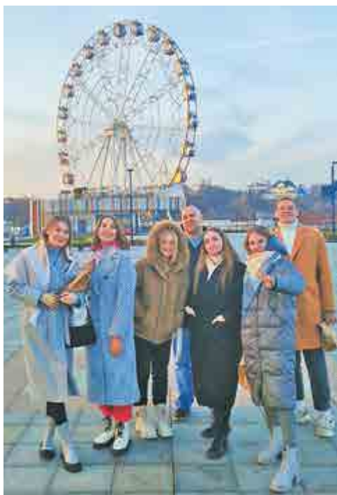
У колеса обозрения в заливе реки Чебоксарки.

Активисты Молодежного совета побывали в Чебоксарах. Экскурсионной поездкой в столицу Чувашии их поощрило руководство завода за активную и плодотворную работу.