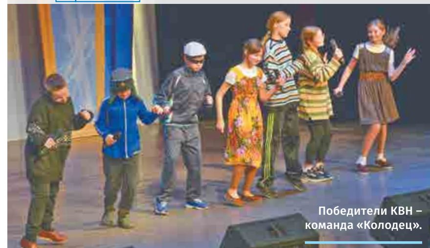
Победители КВН – команда «Колодец».