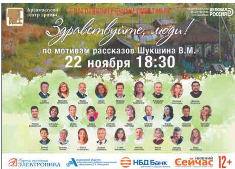
для лиц старше 12 лет

Желаем красотой и счастьем Светиться искренне всегда. Пусть жизнь приносит только радость Сегодня, завтра и всегда! Здоровья доброго, веселья, Удачи искренней в делах, Жить в атмосфере позитива, Всегда с улыбкой на губах! Коллектив участка №7 цеха №49.