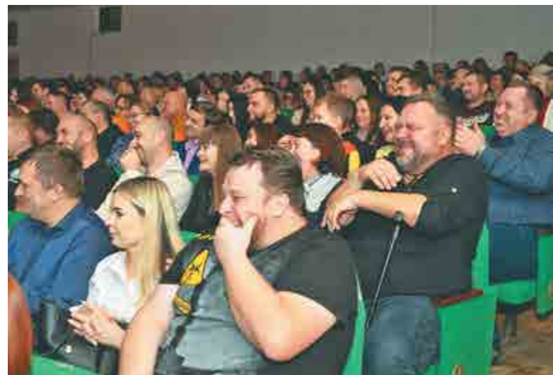
Кэвээнщики подарили зрителям отличное настроение.