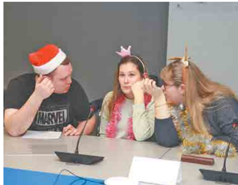
Команда «Рокски» цеха №49 – победители в номинации «Новогодние костюмы».

Наталья БЫЧКОВА, инструктор по организационно-массовой работе ППО АПЗ