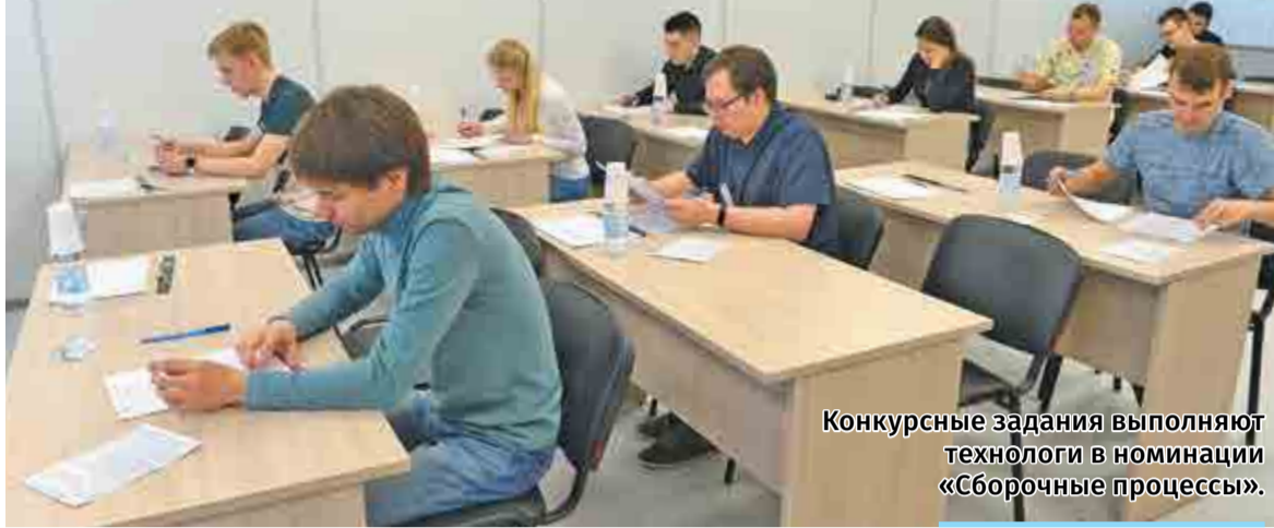
Конкурсные задания выполняют технологи в номинации «Сборочные процессы».

– Неожиданным для меня оказался вопрос про материал шлифовальных кругов. Обязательно изучу его потом. Поэтому конкурс для меня – это не только проверка знаний, но и стимул к