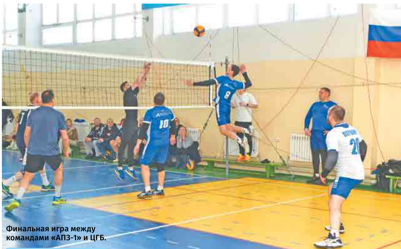
Финальная игра между командами «АПЗ-1» и ЦГБ.

Призеры соревнований получили медали и денежные призы от организаторов турнира, а победителям вручили переходящий кубок.