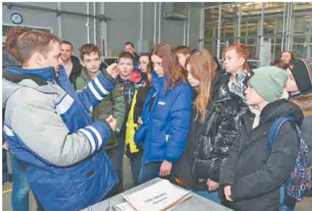
В цехе №56.

В ходе экскурсии ребята рассматривали экспонаты, задавали вопросы, а в завершение разгадали тематический кроссворд по