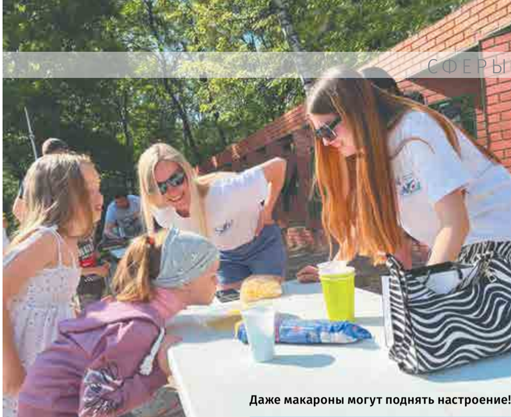
Даже макароны могут поднять настроение!

– В администрации города ко Дню молодежи нам предложили провести мероприятие в парке. Мы объединили свои усилия с ребятами из политеха и организовали игровую площадку. Благодарим всех, кто пришел и поддержал наше мероприятие! Праздник удался.