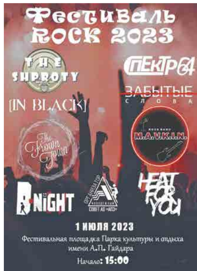
Для лиц старше 12 лет