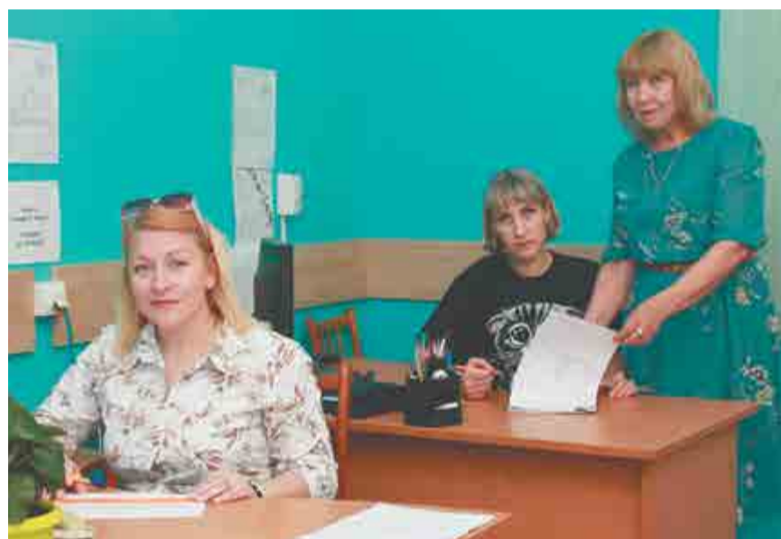
Оформлением договоров на проведение работ подрядными организациями занимаются специалисты бюро планово-предупредительного ремонта ОГЭ.

№№3, 4, 5, 6. Будет построена новая эстакада, произведена укладка стальных трубопроводов в предутеплении из ППУ-изоляции, что обеспечит надежность теплоснабжения и сократит потери тепловой энергии.