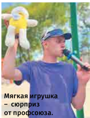
Мягкая игрушка – сюрприз от профсоюза.

Мимо такой яркой и звонкой площадки пройти было невозможно. Посетители парка – от мала до велика – быстро заполнили пространство и включились в различные активности. Задания на любой вкус и без возрастных ограничений – и на ловкость, и на смекалку, и на интеллект: построй башню из гаек, реши sudoku, собери деревянную головоломку, прочитай текст на скорость и другие. Выполнил задание –