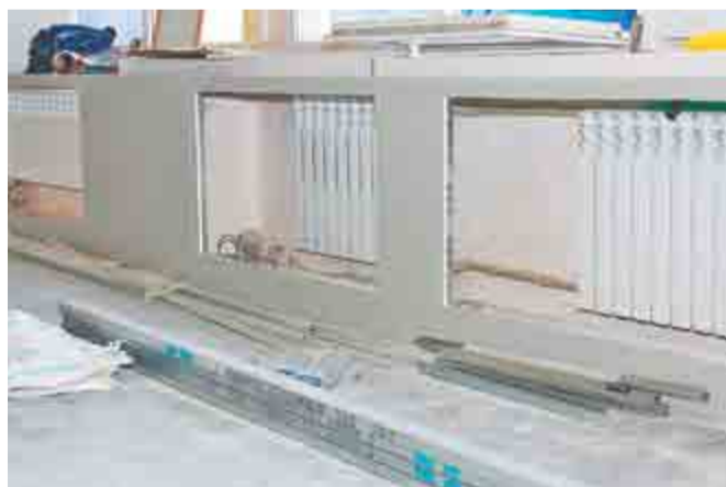
Семь биметаллических радиаторов отопления установлены в помещении буфета в корпусе №23, где завершается капитальный ремонт.

– Какие масштабные работы еще предстоит выполнить?