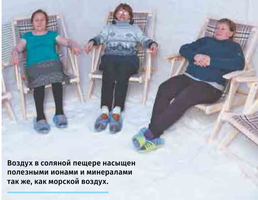
Воздух в соляной пещере насыщен полезными ионами и минералами так же, как морской воздух.