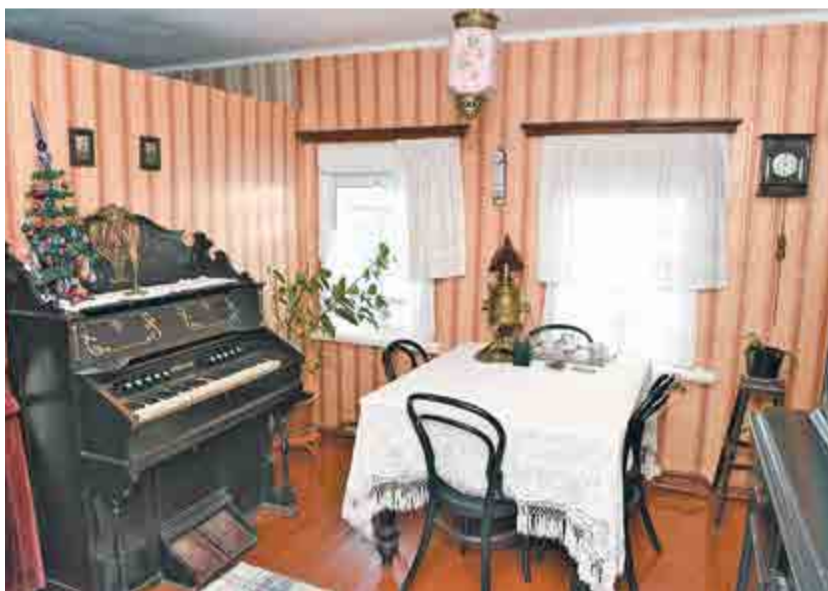
В экспозиции музея, состоящей из четырех комнат-залов, представлены личные вещи семьи Голиковых: одежда, мебель и кухонная утварь.

Из сеней попадаем в жилую часть. Здесь кухня с большой русской печью, гостиная, спальня родителей и детская комната. Везде воссоздана подлинная обстановка семьи Голиковых. Вот фисгармония – в семье любили музыку; на столе самовар, который брали с собой на Мокрый овраг – на семейные пикники, как бы сейчас сказали. На стене в детской – карта: ее Наталья Аркадьевна, мама будущего писателя, специально купила в 1914 году после неудачного побега десятилетнего