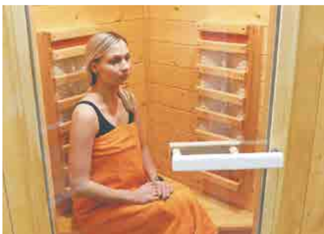
Инфракрасная сауна является прекрасным методом очищения организма, ускорения обмена веществ и средством контроля веса.