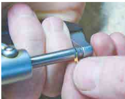
Замер толщины микрометром.