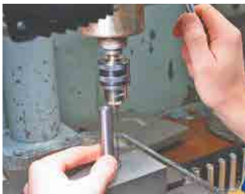
Сверление на сверлильном станке.