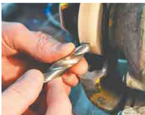
Заточка сверла на заточном станке.