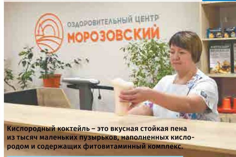
Кислородный коктейль – это вкусная стойкая пена из тысяч маленьких пузырьков, наполненных кислородом и содержащих фитовитаминный комплекс.