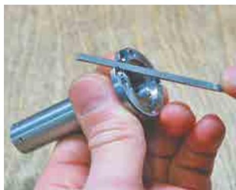
Опиловка радиуса надфилем.