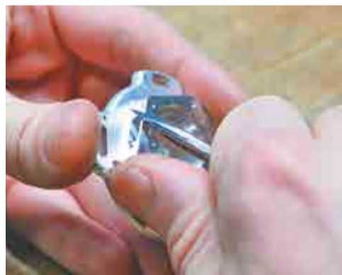
Снятие заусенцев шабером.