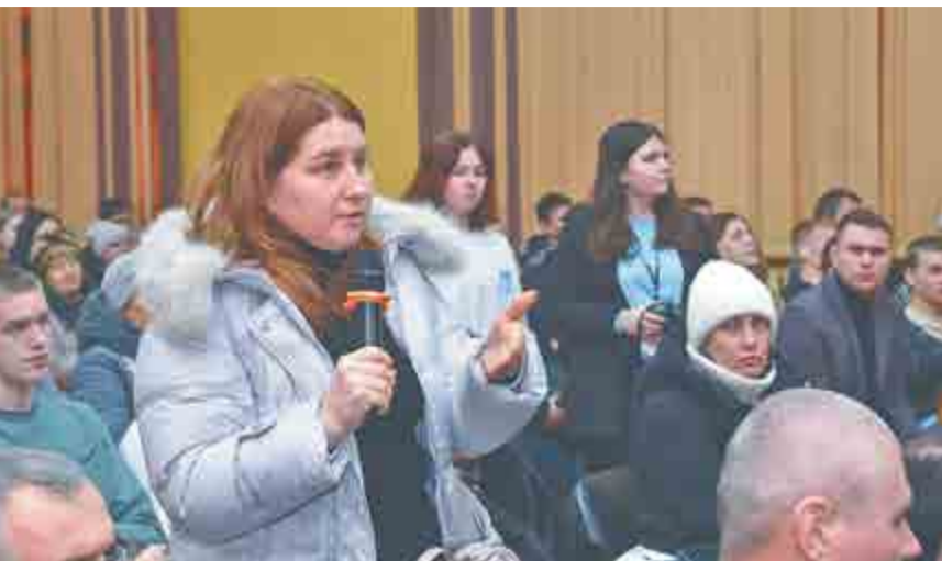
Родители студентов АПК активно задавали вопросы о работе на АПЗ и совмещении ее с учебой.