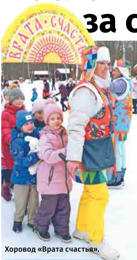
Хоровод «Врата счастья».