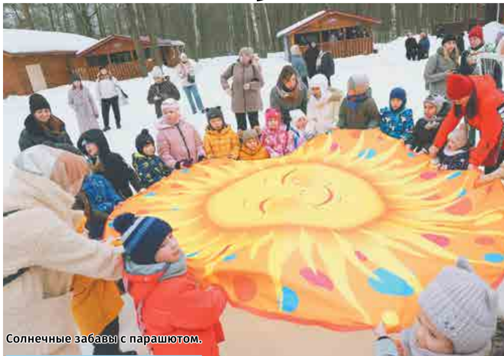
Солнечные забавы с парашютом.