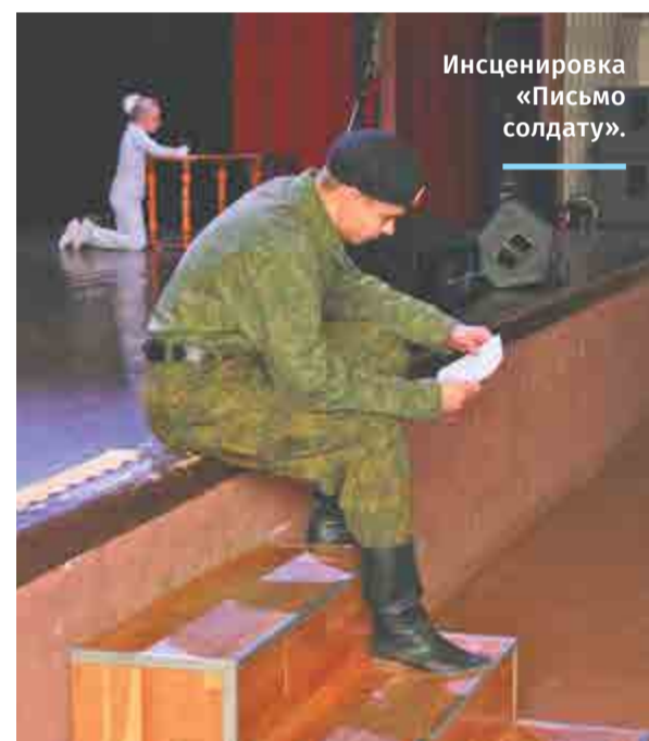
Инсценировка «Письмо солдату».

В ДК «Ритм» прошел благотворительный концерт в поддержку детей присоединенных территорий.