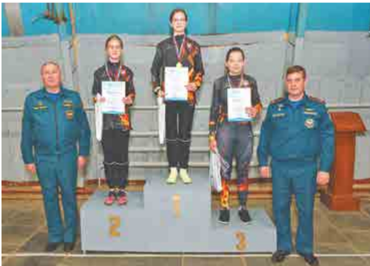
На пьедестале почета спортсменки младшей возрастной группы.