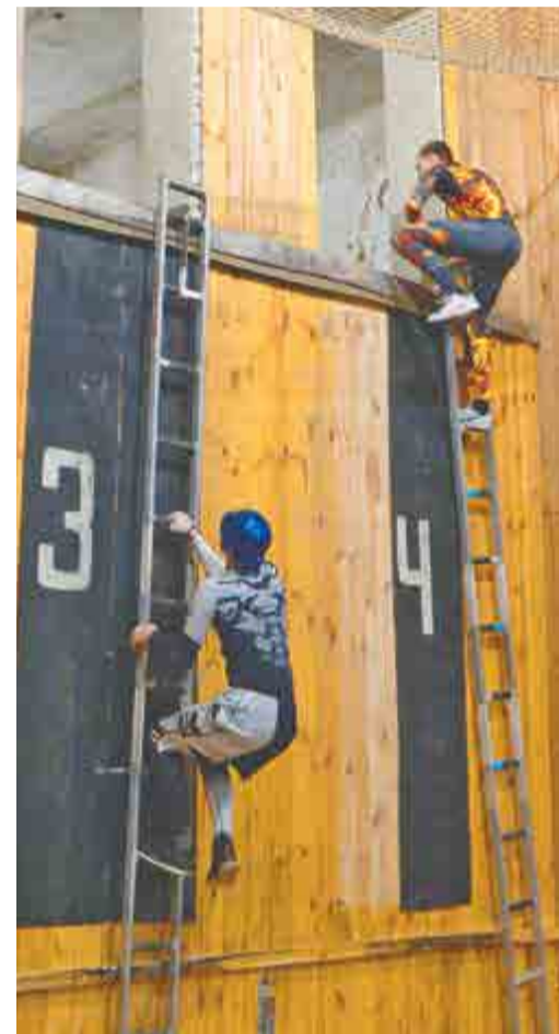
Высота первого пролета учебной башни – 5 м.

Видеосюжет смотрите в группе АПЗ www.vk.com/oapz