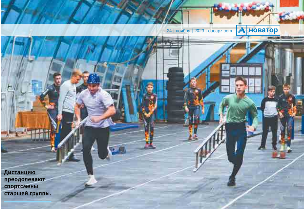
Дистанцию преодолевают спортсмены старшей группы.