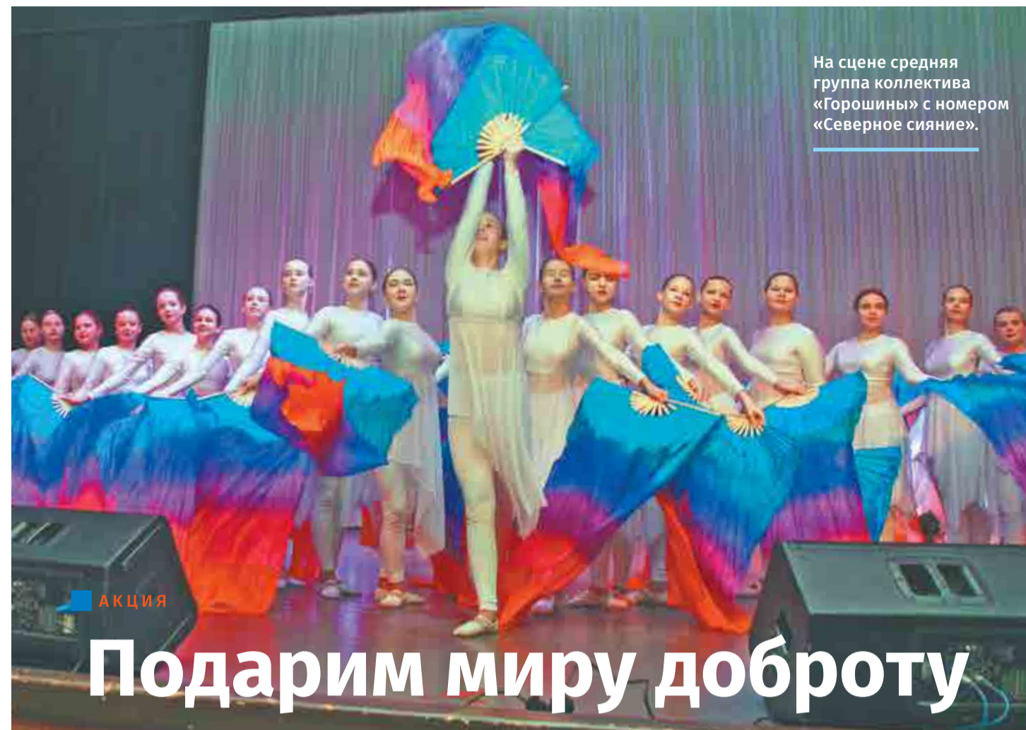
На сцене средняя группа коллектива «Горошины» с номером «Северное сияние».