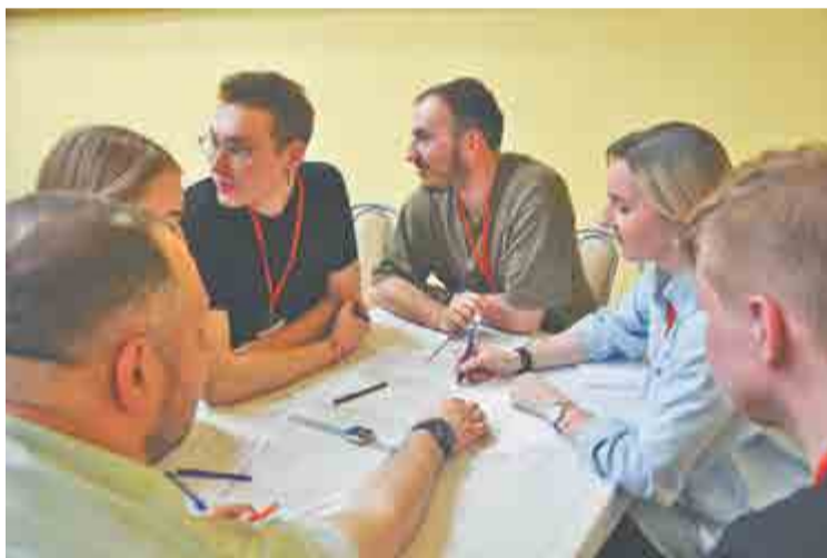
Команда №25 – победители деловой игры.

денных членами команды за год, и о программе сертификатов для членов МС.