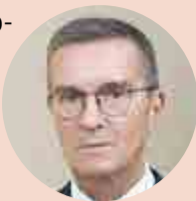
Борис ОБНОСОВ, генеральный директор КТРВ

Пусть наши благие дела и устремления служат дальнейшему развитию и процветанию России!