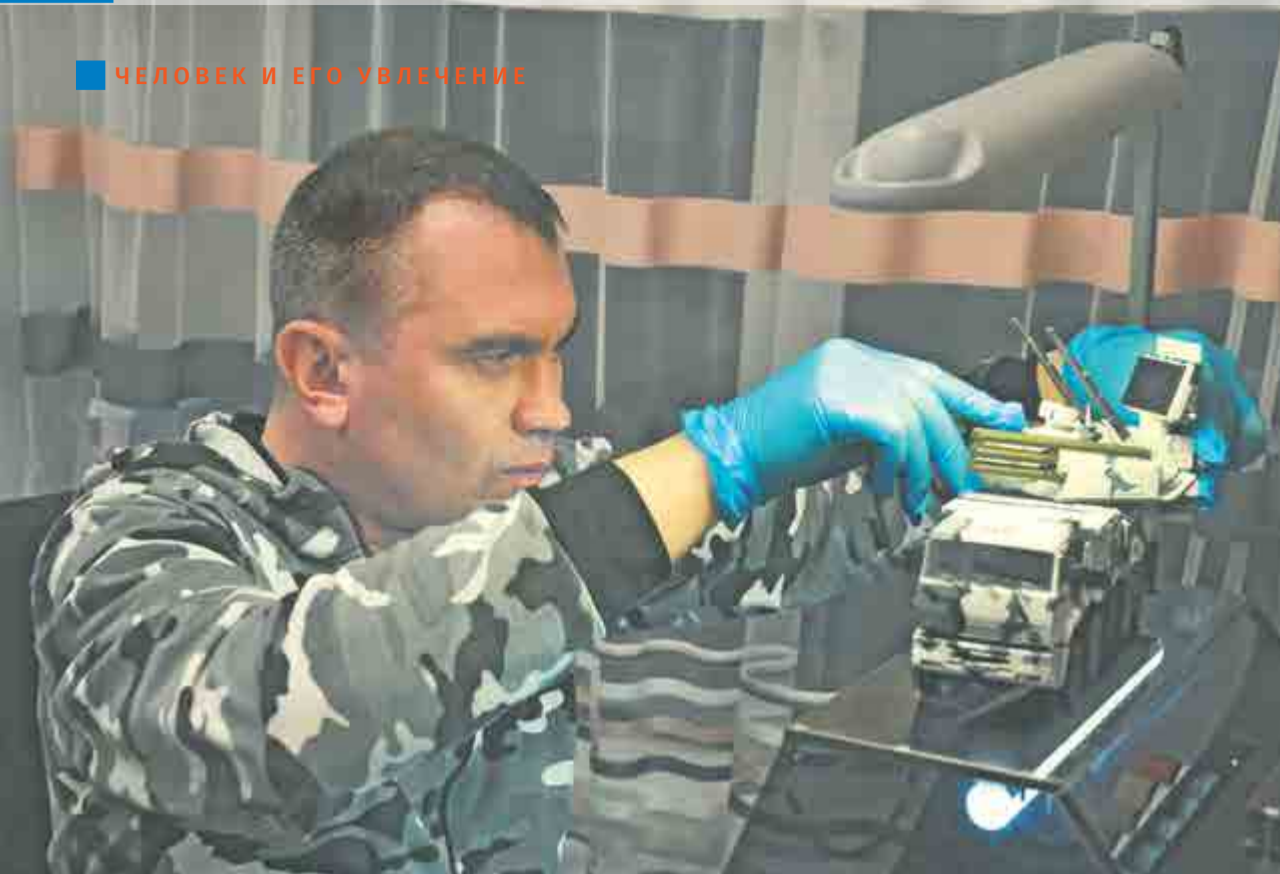
Последние штрихи в сборке ЗРПК «Панцирь-С1».