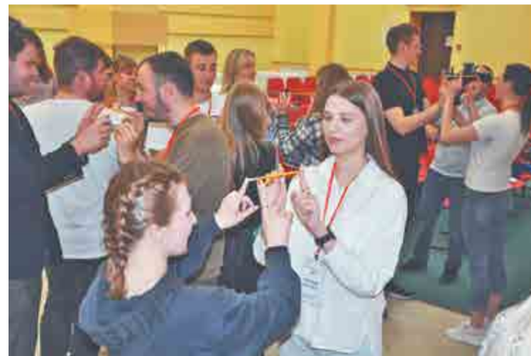
Одно из упражнений командообразующего тренинга – «Карандаши».

– Нам рассказывали про социальную адаптацию, важные моменты записывала, ведь эта информация не только поможет мне самой до конца адаптироваться, но и позволит помогать молодым людям, которые придут на завод. Буду передавать знания, которые получила здесь.