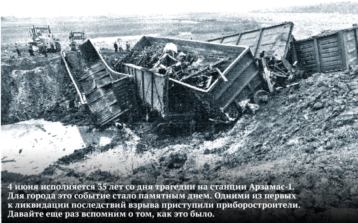
4 июня исполняется 35 лет со дня трагедии на станции Арзамас-1. Для города это событие стало памятным днем. Одними из первых к ликвидации последствий взрыва приступили приборостроители. Давайте еще раз вспомним о том, как это было.