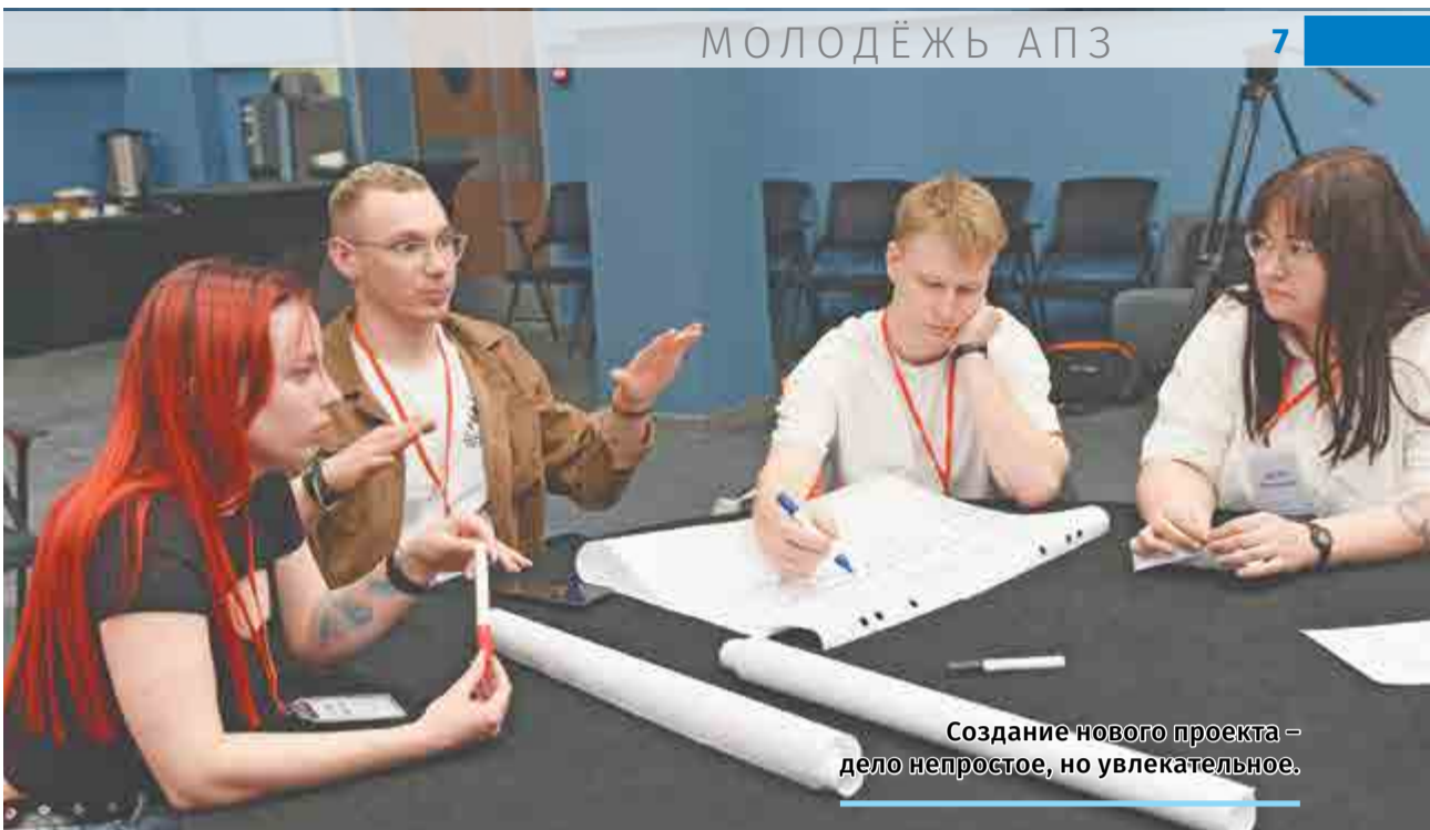
Создание нового проекта – дело непростое, но увлекательное.

Во второй части форума четыре команды под руководством опытных активистов МС разработали и защитили проекты, которые готовы реализовать своими