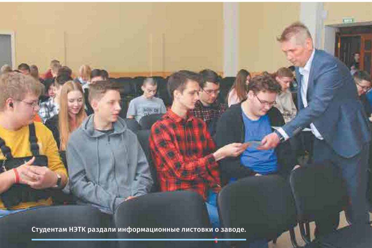
Студентам НЭТК раздали информационные листовки о заводе.

Студенты Нижегородского экономико-технологического колледжа узнали о трудоустройстве на АПЗ, возможности пройти на предприятии производственную практику или устроиться на летний период.