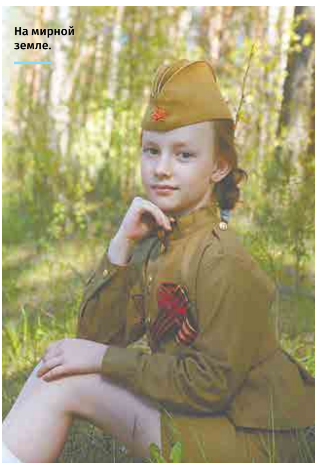
На мирной земле.