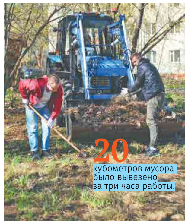
20 кубометров мусора было вывезено за три часа работы.

Видеосюжет смотрите в группе АПЗ www.vk.com/aoarpz