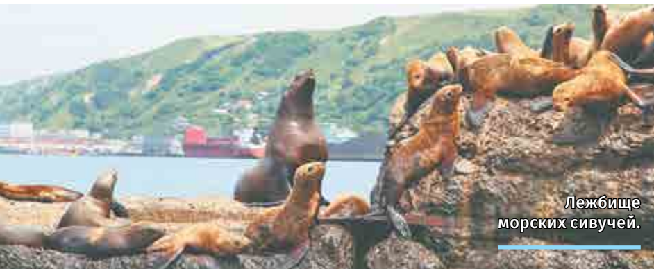
Лежбище морских сивучей.