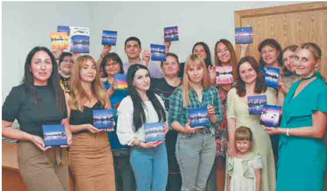
Участники мастер-класса по рисованию со своими работами.

Приезжайте на знакомство и звоните, пишите Viber, WhatsApp +7-910-870-5356.