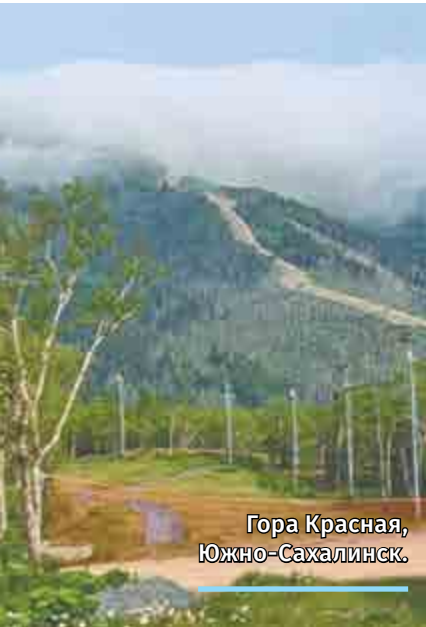
Гора Красная, Южно-Сахалинск.