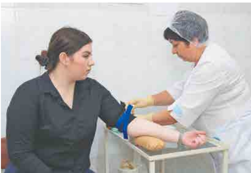
Теперь в «Морозовском» можно сдать анализ крови.