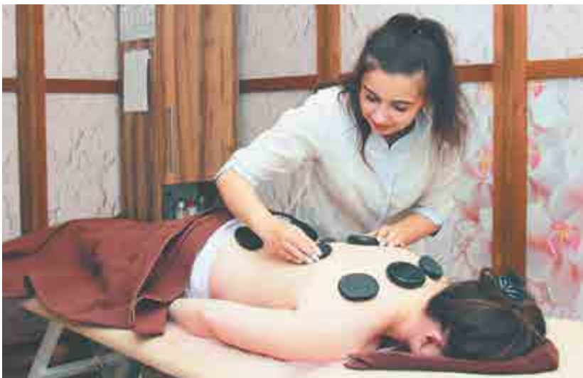
Новая процедура – массаж теплыми камнями.

– Да, все верно. Мы можем провести порядка 600 лабораторных исследований. Это общий и расширенный анализ крови, на гормоны щитовидной железы, онкомаркеры, биохимические показатели крови, ревматоидные и суставные факторы, ионный состав крови, определить скрытую инфекцию, наличие или недостаток витаминов и другие. Работаем с нижегородской лабораторией, результаты можно получить на следующий день, это быстро и удобно.