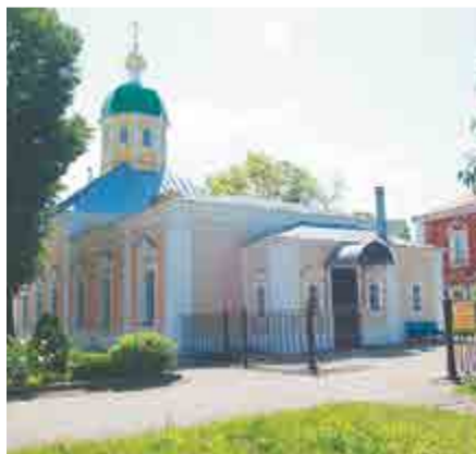
Церковь Андрея Первозванного на ул. Владимирского. Построена в 1793 году.