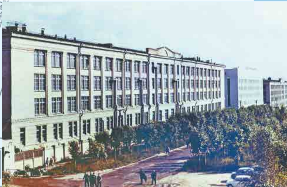
Арзамасский приборостроительный завод стал главной достопримечательностью улицы 50 лет ВЛКСМ.

РАССКАЗЫВАЕМ ОБ ИСТОРИИ ГОРОДСКИХ УЛИЦ, ПО КОТОРЫМ МОЖНО ВЫЙТИ К ПРОХОДНОЙ ПРИБОРОСТРОИТЕЛЬНОГО ЗАВОДА.