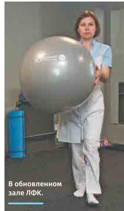
В обновленном зале ЛФК.

– Это стоун-терапия , или массаж теплыми кам-