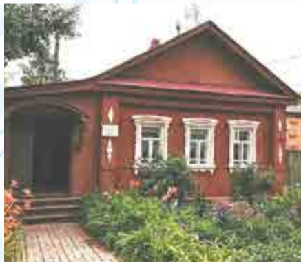
Дом на ул. Горького, в котором с 1912 по 1918 год жил писатель Аркадий Гайдар.

Гайдара, литературно-музейный комплекс, а позже открылось детское кафе «Голубая чашка» (сегодня «Замок де Санти»). Но до того как Гайдар приобрел всесоюзную славу, Новоплотинной присвоили имя другого классика литературы. В 1928 году в СССР отмечались 60-летие со дня рождения Максима Горького и 35-летие его литературной деятельности, поэтому президиум горсовета решил увековечить имя писателя. Дом, где основоположник соцреализма отбывал арзамасскую ссылку в 1902 году, находился на улице, которой к тому моменту уже присвоили имя Карла Маркса, – в двух шагах от еще не переименованной улочки Новоплотинной, поэтому решение о переименовании созрело само собой.