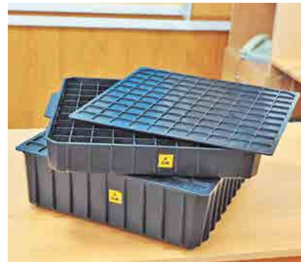
Страницу подготовила Екатерина ЯДРОВА

Ранее антистатическую тару уже поставляли в АНПП «Темп-Авиа», а также ПАО «Завод «Красное знамя».