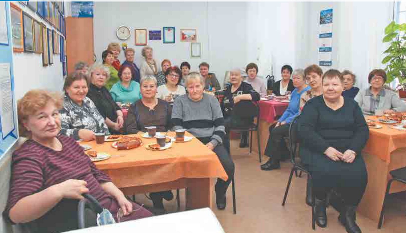
Актив Совета ветеранов АПЗ.