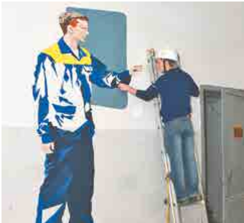
Размер картины – 2,5х3,5 м.

– Однажды меня попросили сфотографироваться во время работы. Вскоре я увидел, как в коридоре художник рисует огромную картину. В главном герое узнал себя, – рассказал