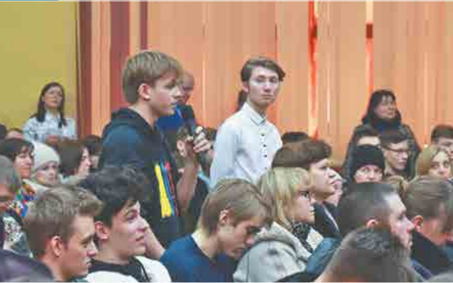
Студенты приборостроительного колледжа активно задавали интересующие их вопросы.