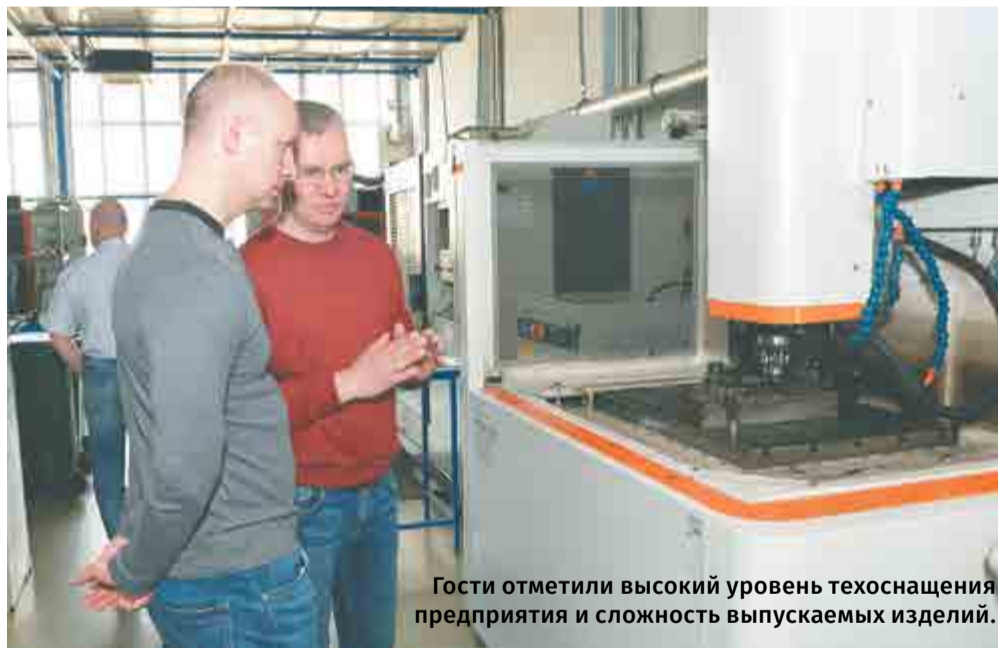
Гости отметили высокий уровень техоснащения предприятия и сложность выпускаемых изделий.

Видеосюжет смотрите в группе АПЗ www.vk.com/oapz