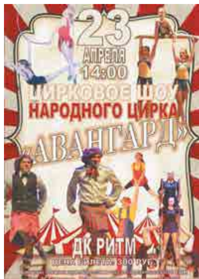
Без возрастных ограничений