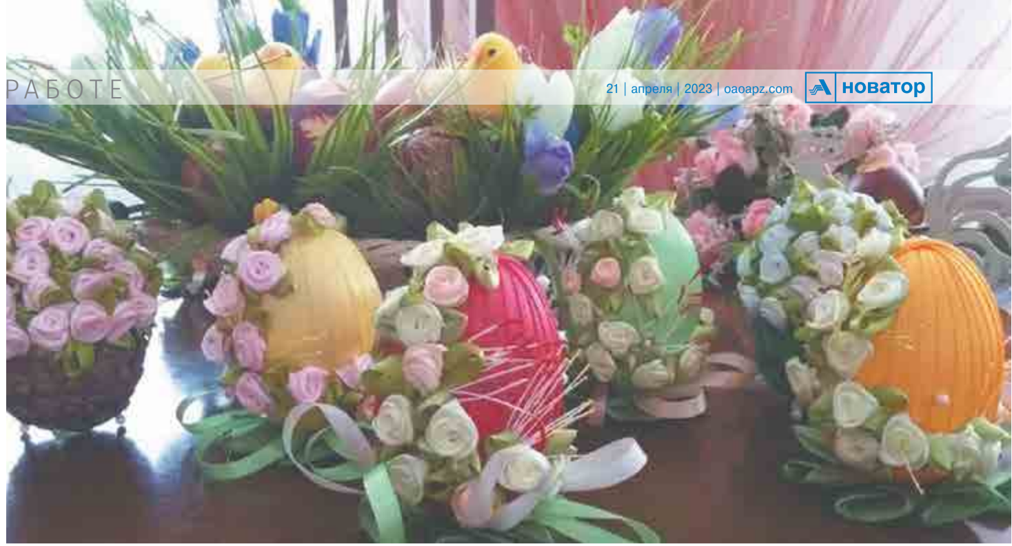
Светлана ЛАЗАРЕВА, техник по инструменту СГТ