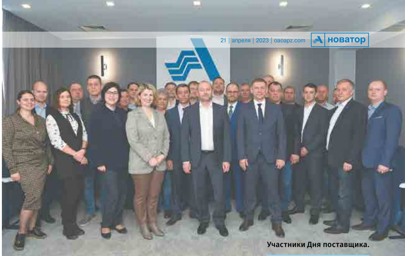
Участники Дня поставщика.