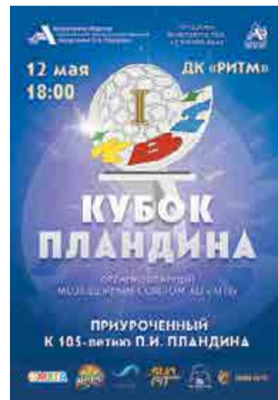
для лиц старше 12 лет