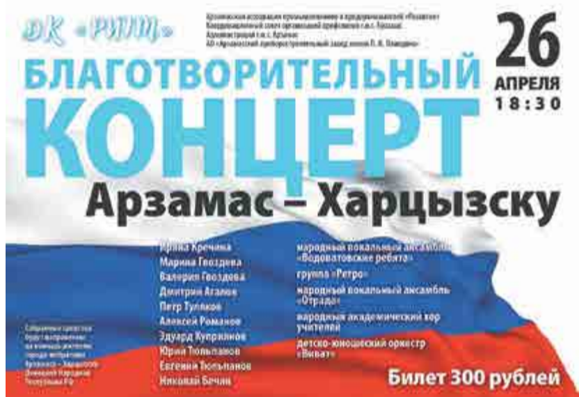
для лиц старше 12 лет