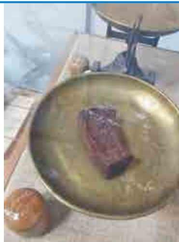
Блокадный хлеб. Музей обороны и блокады Ленинграда.

глубине 13 метров, под постоянными обстрелами.