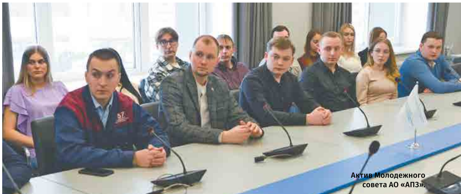
Актив Молодежного совета АО «АПЗ».