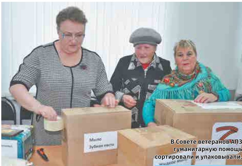
В Совете ветеранов АПЗ гуманитарную помощь сортировали и упаковывали.