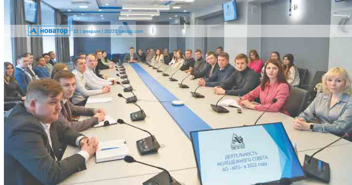
Участники молодежной конференции.