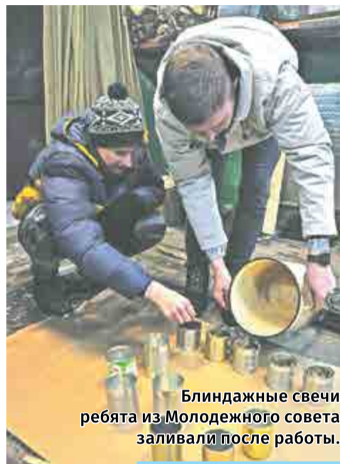
Блиндажные свечи ребята из Молодежного совета заливали после работы.

Приборостроители приняли активное участие в сборе гуманитарной помощи для жителей Луганской и Донецкой республик и солдат, находящихся в зоне действия специальной военной операции.