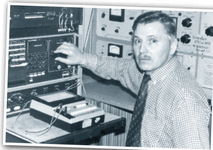
В лаборатории службы метрологии, 2001 год.

Наталья ГЛАЗУНОВА