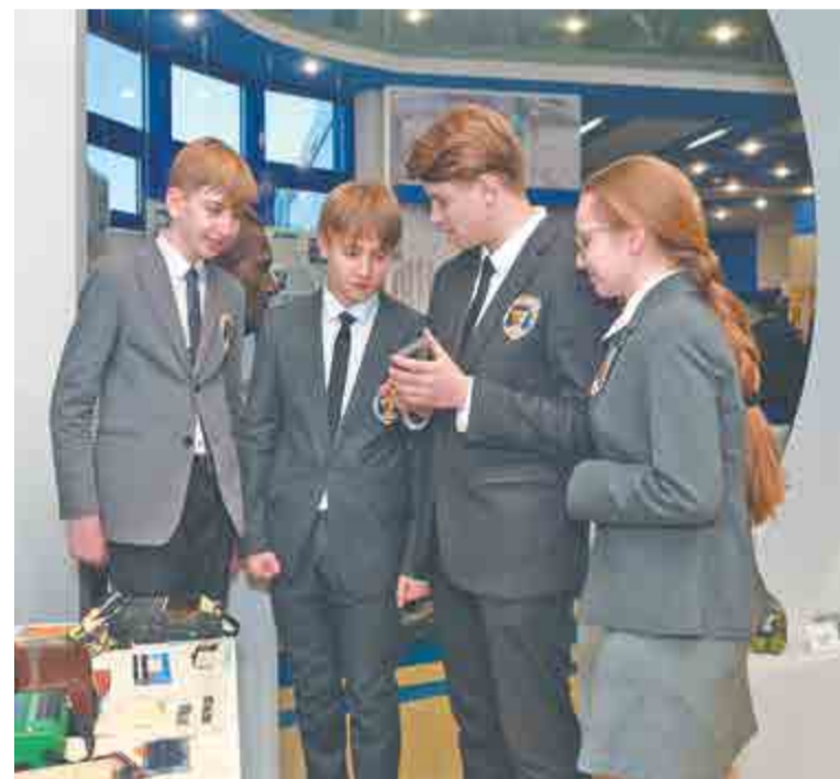
Лицеисты инженерного 8 «В» класса с интересом разглядывали музейные экспонаты.

– Традиции технического образования в лицее заложены давно, и сегодня наше многолетнее сотрудничество с АПЗ выходит на но-