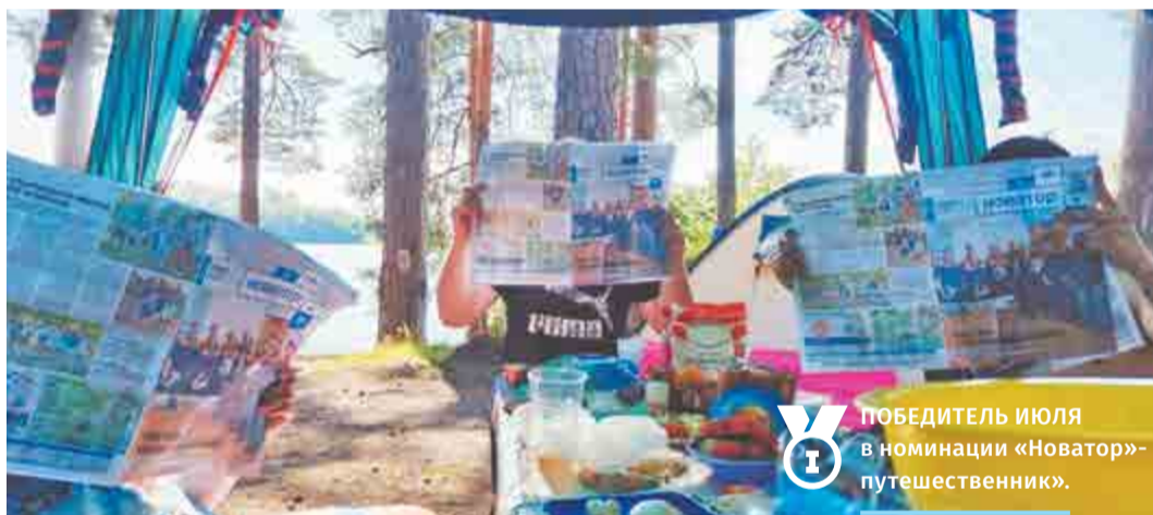
ПОБЕДИТЕЛЬ ИЮЛЯ в номинации «Новатор-путешественник».