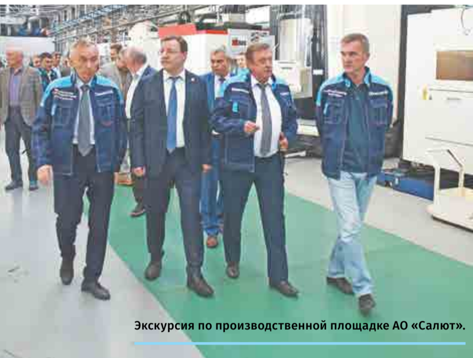
Экскурсия по производственной площадке АО «Салют».

Заседание Совета Корпорации «Тактическое ракетное вооружение» – генеральных директоров предприятий КТРВ состоялось на базе АО «Салют» в Самаре.