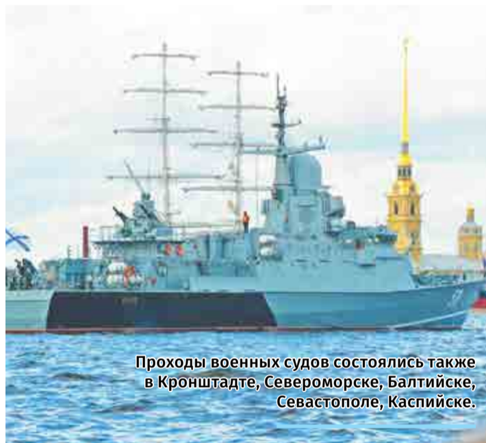
Проходы военных судов состоялись также в Кронштадте, Североморске, Балтийске, Севастополе, Каспийске.