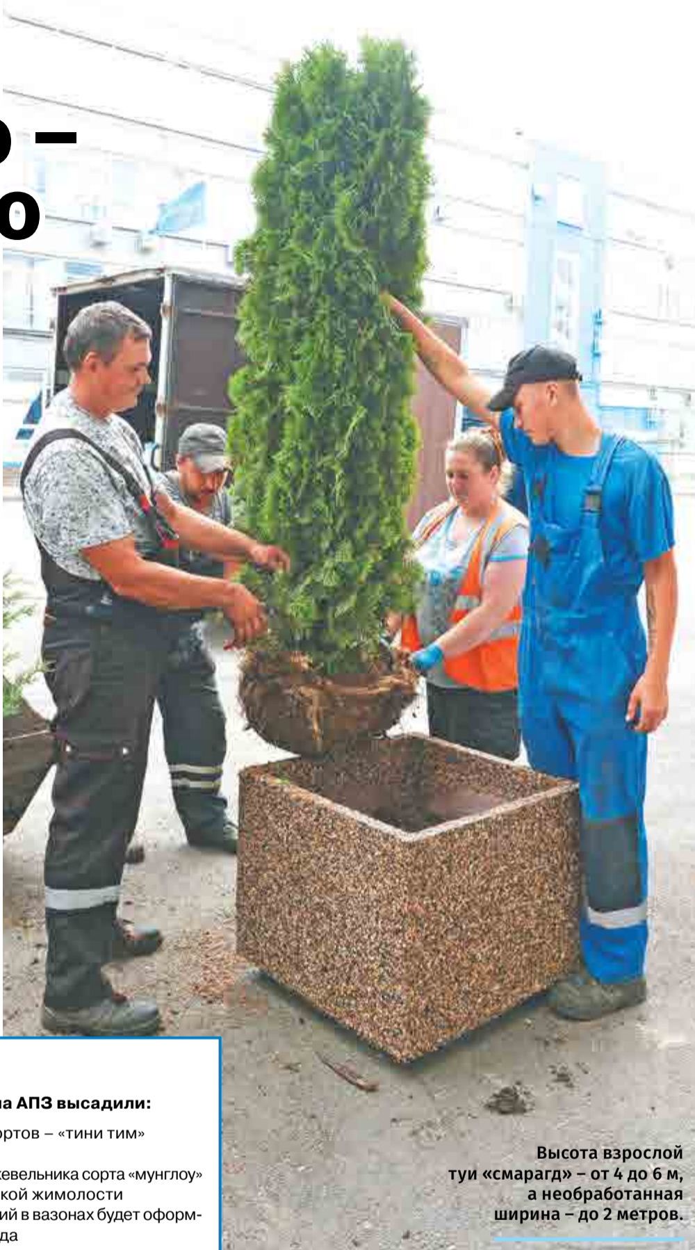
Высота взрослой туй «смарагд» – от 4 до 6 м, а необработанная ширина – до 2 метров.

Екатерина ЯДРОВА