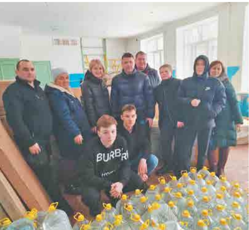
После разгрузки гуманитарной помощи – фото на память.

Ирина БАЛАГУРОВА