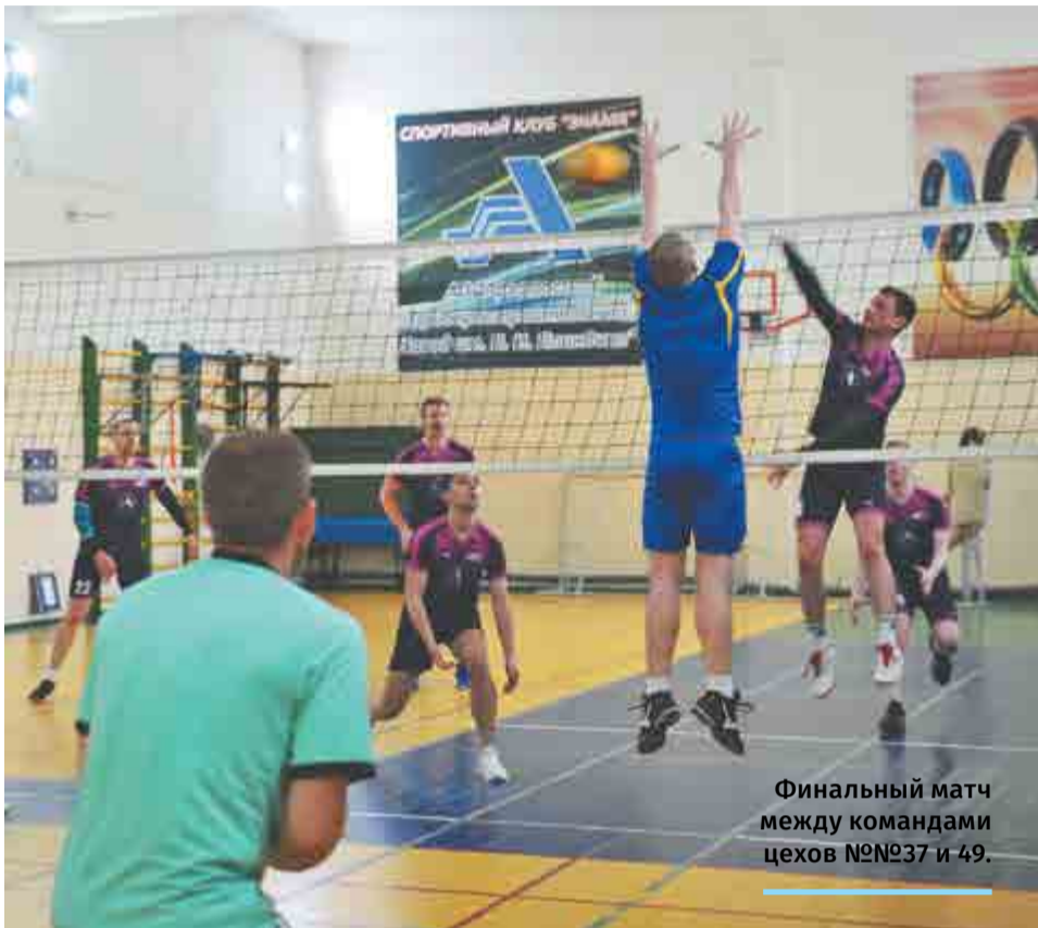
Финальный матч между командами цехов №№37 и 49.

В финале третий год подряд встретились команды сборщиков. Спортсмены показали высочайший уровень игры, но победу снова одержала сборная цеха 49-го. Поздравляем спортсменов!