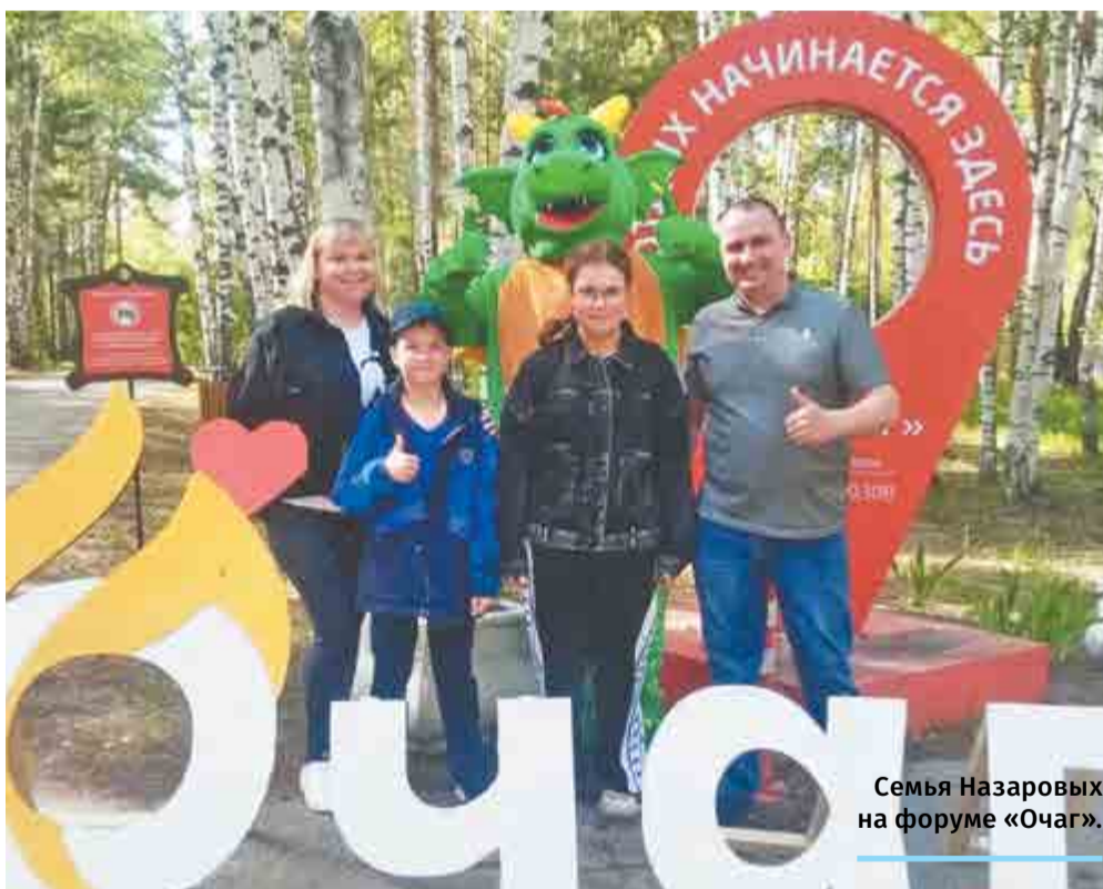
Семья Назаровых на форуме «Очаг».

Проект «Региональный семейный форум «Очаг» реализуется в г.о.г. Выкса при грантовой поддержке Федерального агентства по делам молодежи «Росмолодежь».